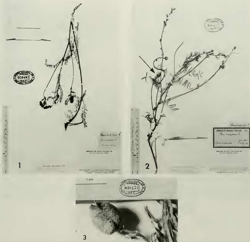
FIGURA 1. Lectotipo de Astragalus verticillatus (Phil.) Reiche ( Phaca verticillata Phil.) SGO 50497. FIGURA 2. Holotipo de Astragalus maulensis Speg. ( Phaca brachytropis Phil.) SGO 40154. FIGURA 3. Fruto de A. maulensis Speg. SGO 40154.

SPEGAZZINI, C. 1902. Nova Addenda ad Fl. Patagonicam (Part III), Anales Mus. Nac. Buenos Aires 7: 264.